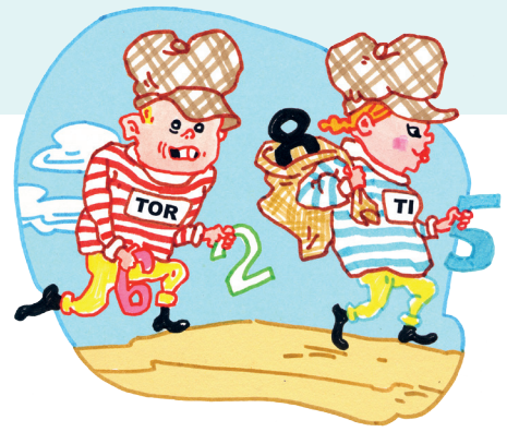
Tor og Tine Tyv